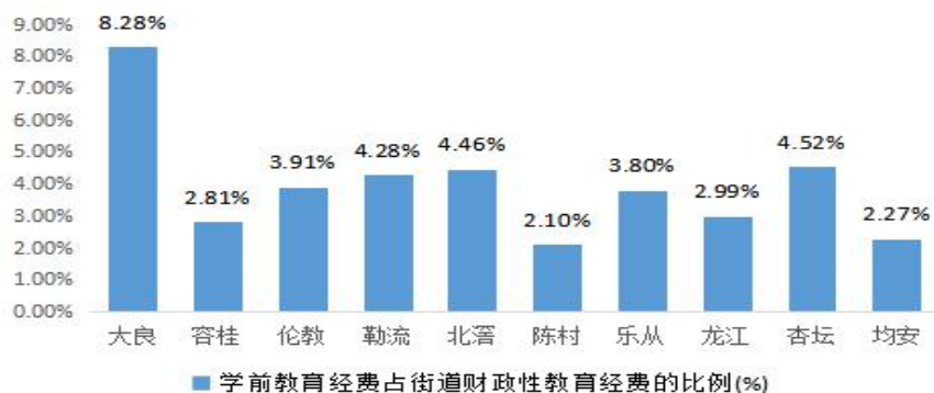
表 4 各镇（街道）学前教育经费占比（2017 年数据）

3.投入结构不合理。 目前我区对普惠性幼儿园的财政扶持实行全部按同一标准执行，没有结合办园属性和办园质量进行分类和引导，尤其是对自办自营园和出租经营园两类集体园按同一标准进行扶持，削弱了自办自营集体园的积极性。